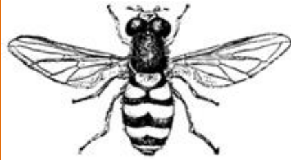
ZWEEFVLIEG (GÉÉN WESP)